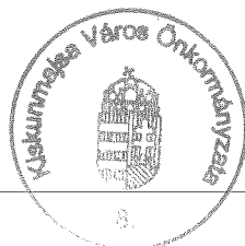
Czombos Csaba bizottság elnöke