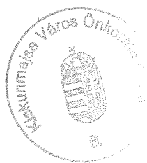
Patkós Zsolt polgármester